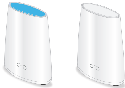
Orbi Mini Router (Modell RBR40)